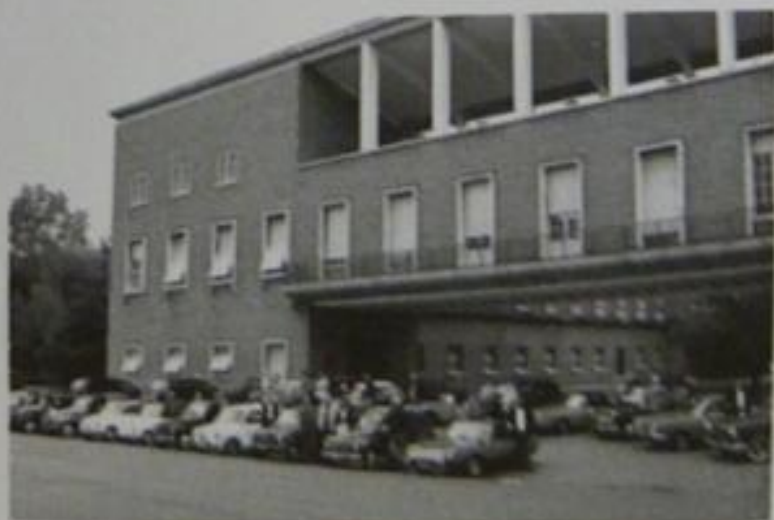
Automobili nel piazzale