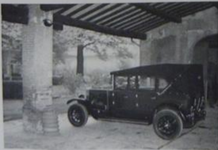
Castello Righini, esterno