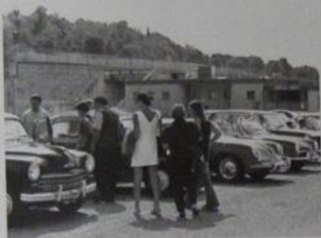
Il paddock del CASF