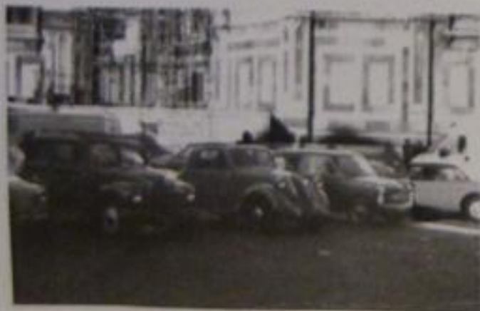
Le auto schierate