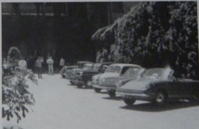
Castello di Uzzano