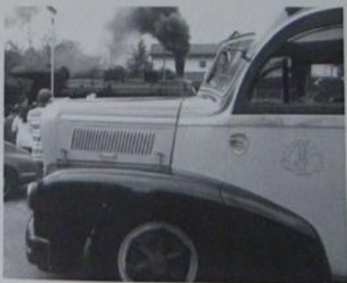
Ruote gommata e ferrate