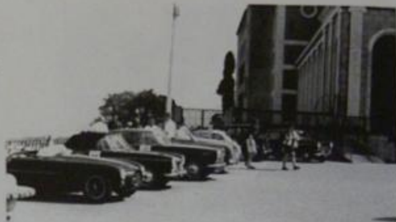
Il parco macchine