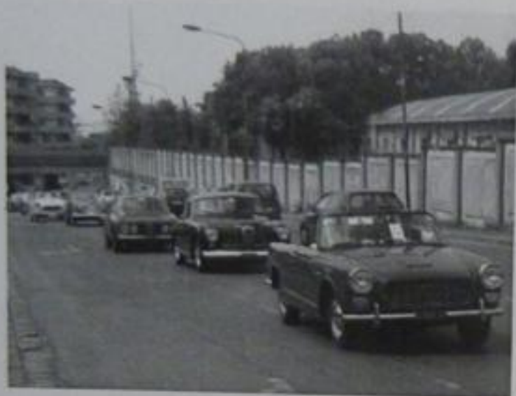
Sulle strade di Sesto Fiorentino