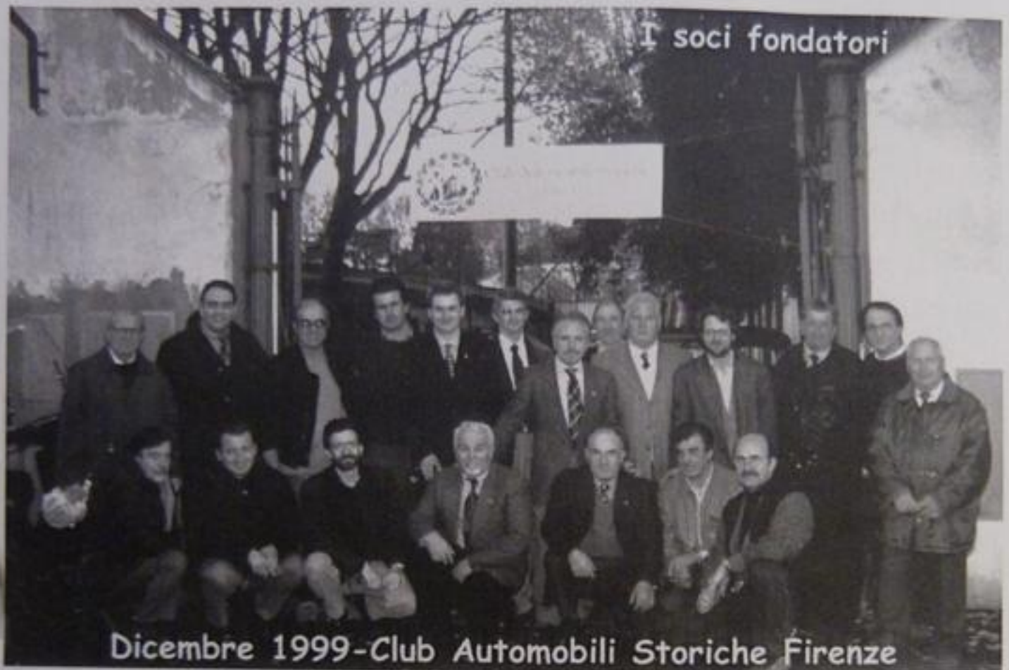
Dicembre 1999 - Club Automobili Storiche Firenze