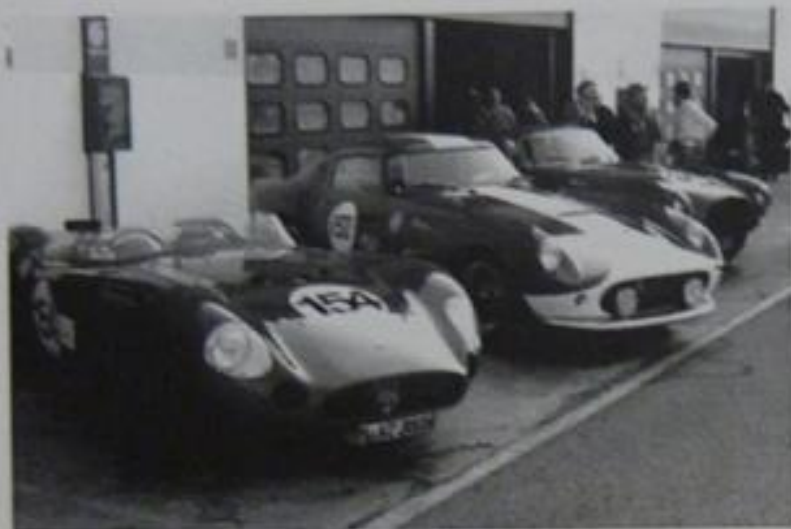
I box dell'Autodromo