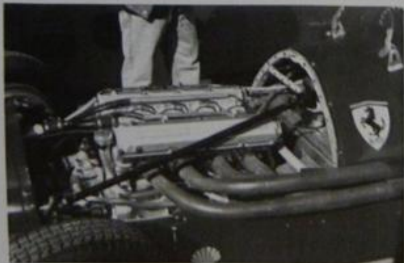
8 cilindri Ferrari