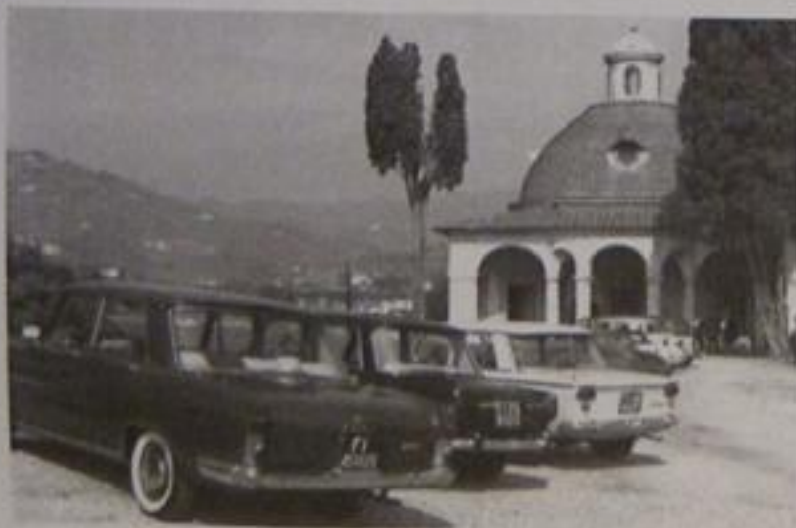
L'esposizione di auto