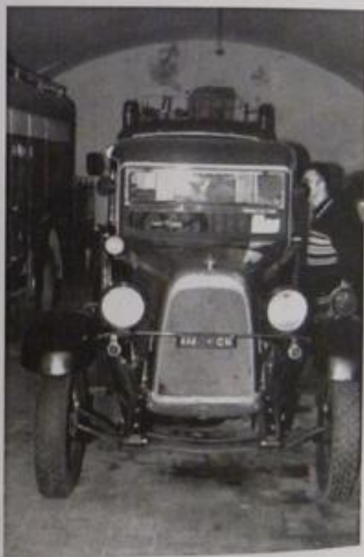
Le cantine del Museo