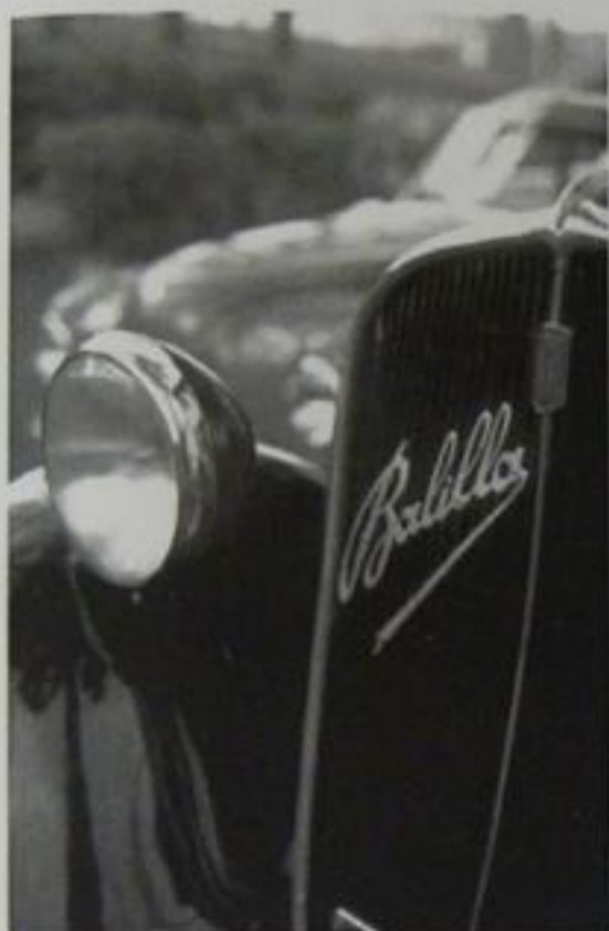
Il muso di una Balilla