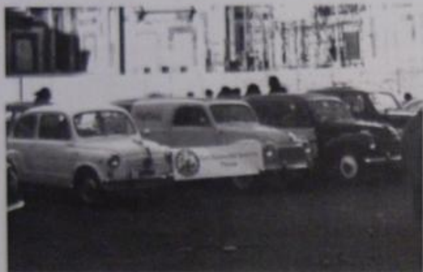
Il CASF in Piazza del Duomo