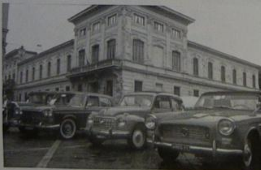
Esposizione in Piazza de' Nerli