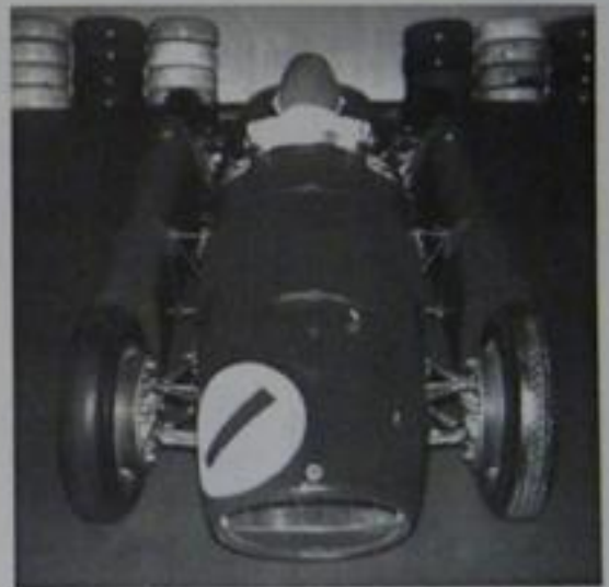
Galleria Ferrari, Maranello