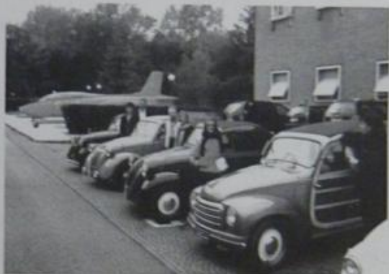
Topolino con il Macchi 326