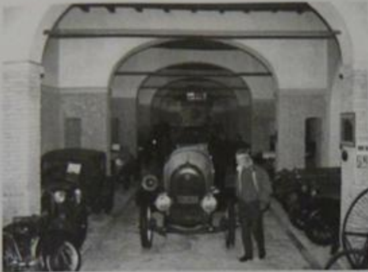
Castello Righini, interno