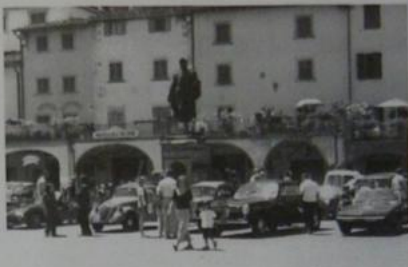
In piazza di Greve in Chianti