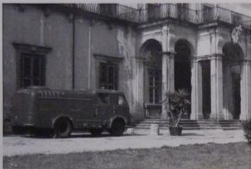
Una vecchia autopompa