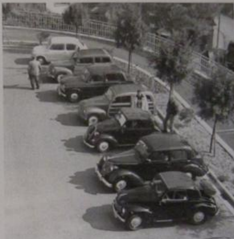
Il parco auto