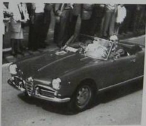
In mezzo alla gente