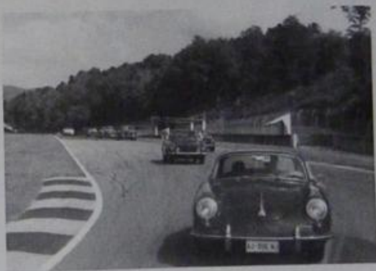
In pista ...