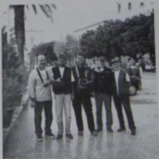
La rappresentanza toscana