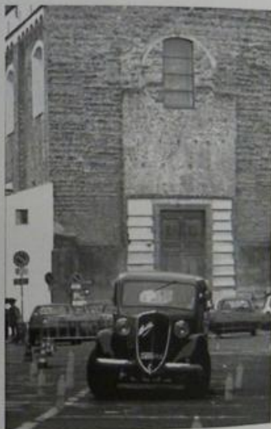
Regolarità in Piazza del Carmine