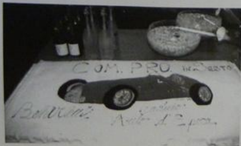
Dolci ... festeggiamenti