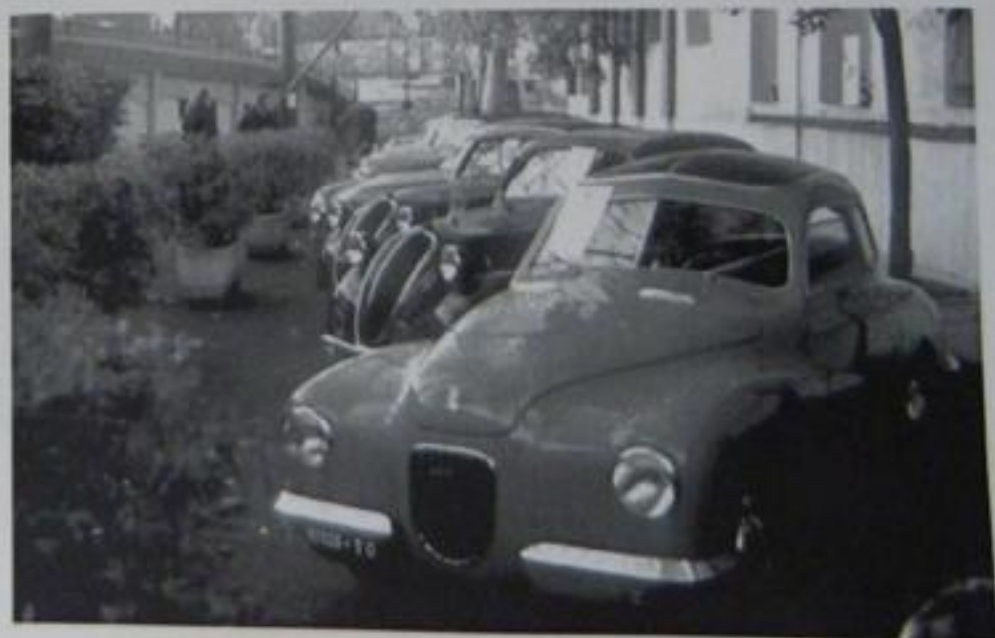
L'esposizione delle auto