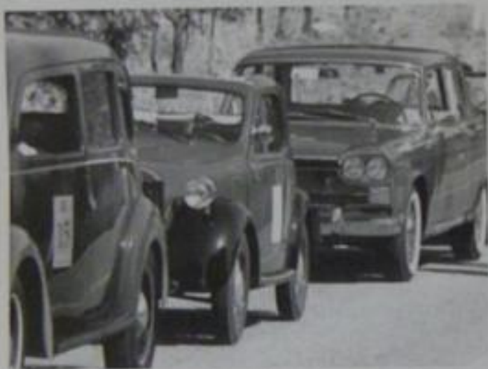
Lungo le strade del Chianti