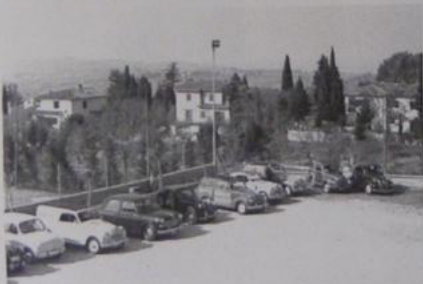
Verso la campagna