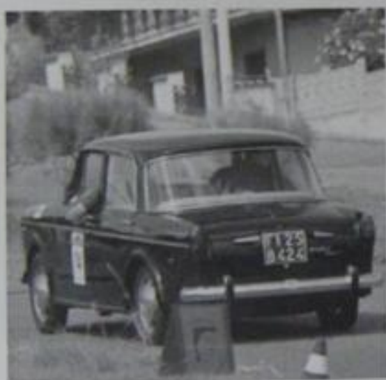
Equipaggio durante una prova di regolarità