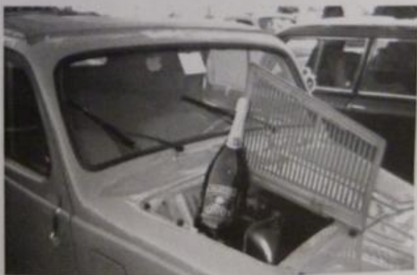
Il brindisi ...