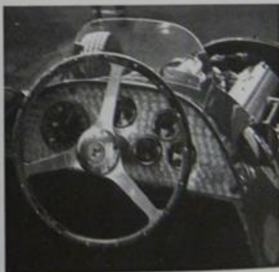
Ferrari Formula 1