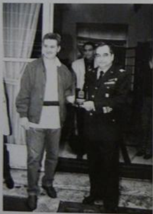
Il Presidente con il Generale Comandante